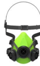
Respiratore Semifacciale BLS SGE46