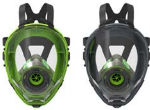
Respiratori a Pieno Facciale BLS 5400 - BLS 5150