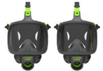
Respiratori a Pieno Facciale BLS 3400 - BLS 3150 (V)