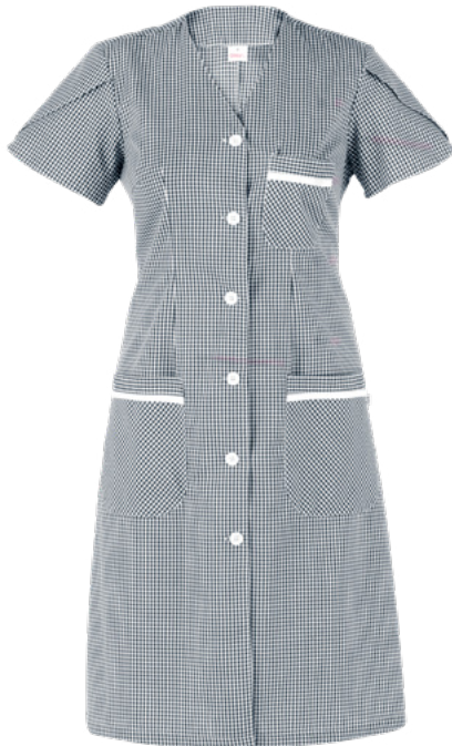
Q32 Black check