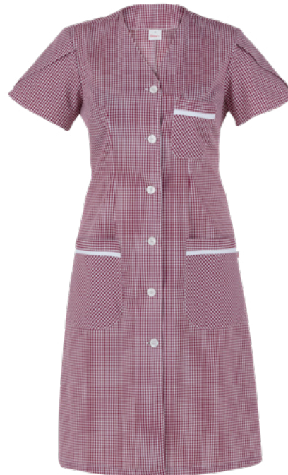
Q35 Bordeaux check