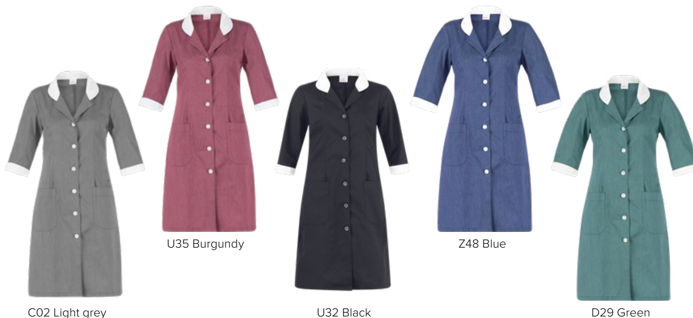
C02 Light grey