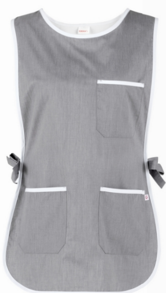
CO2 Grigio chiaro