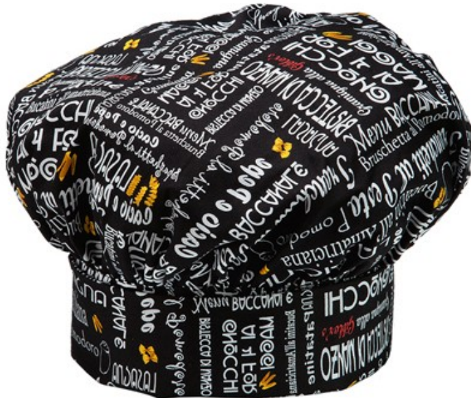
F05 Black menu