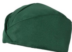
Z49 Verde scuro