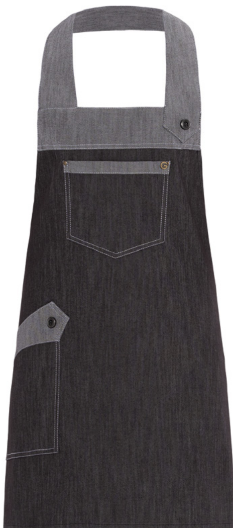
J32 Jeans nero