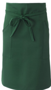
Z49 Verde scuro