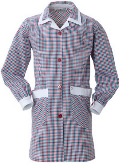
QD – MULTICOLOR/BIANCO