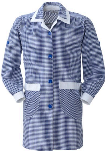
AB – AZZURRO/BIANCO