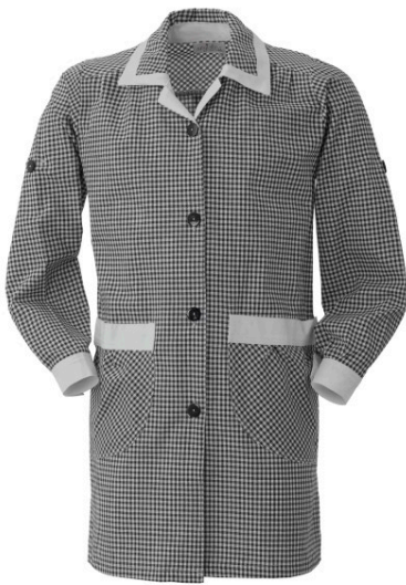
NZ – NERO/BIANCO