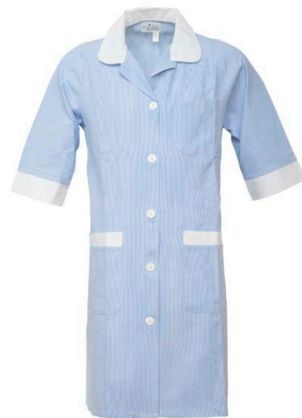
AB – AZZURRO/BIANCO