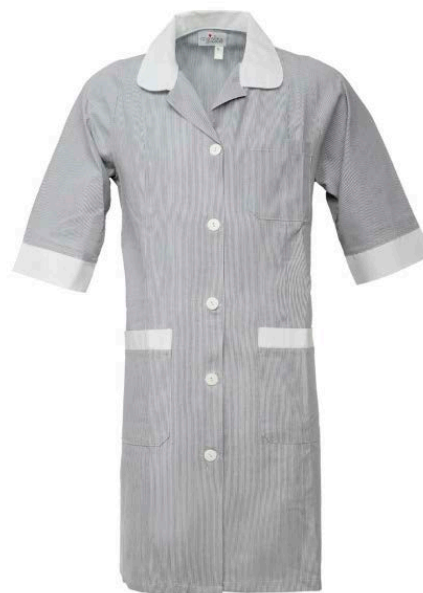
NZ – NERO/BIANCO