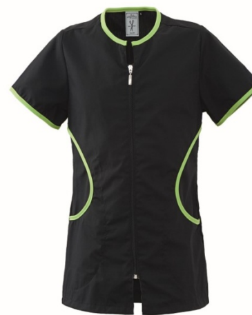
Z3 – NERO/VERDE ACIDO