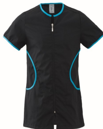
Z2 – NERO/TURCHESE