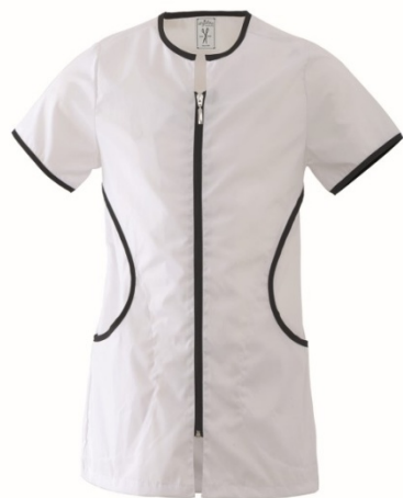
ZJ – BIANCO/NERO