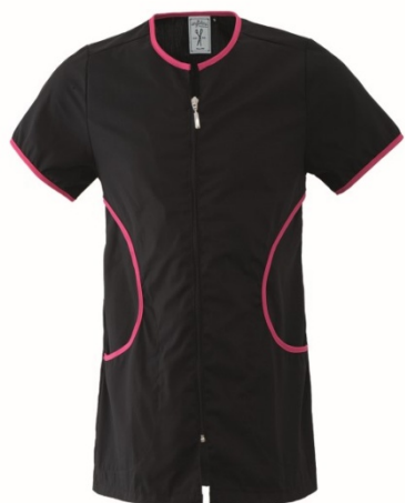
ZI – NERO/FUXIA