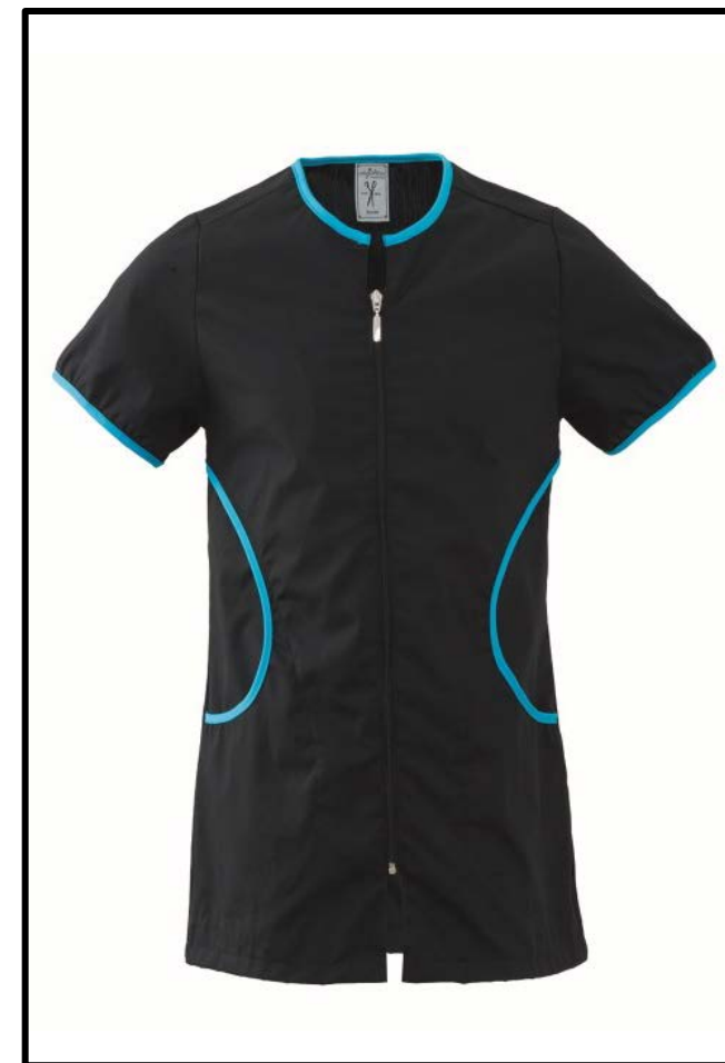
Z2 – NERO/TURCHESE