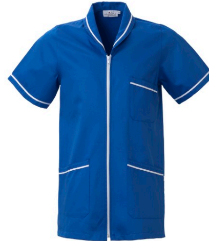
B2 – BLUETTE/BIANCO