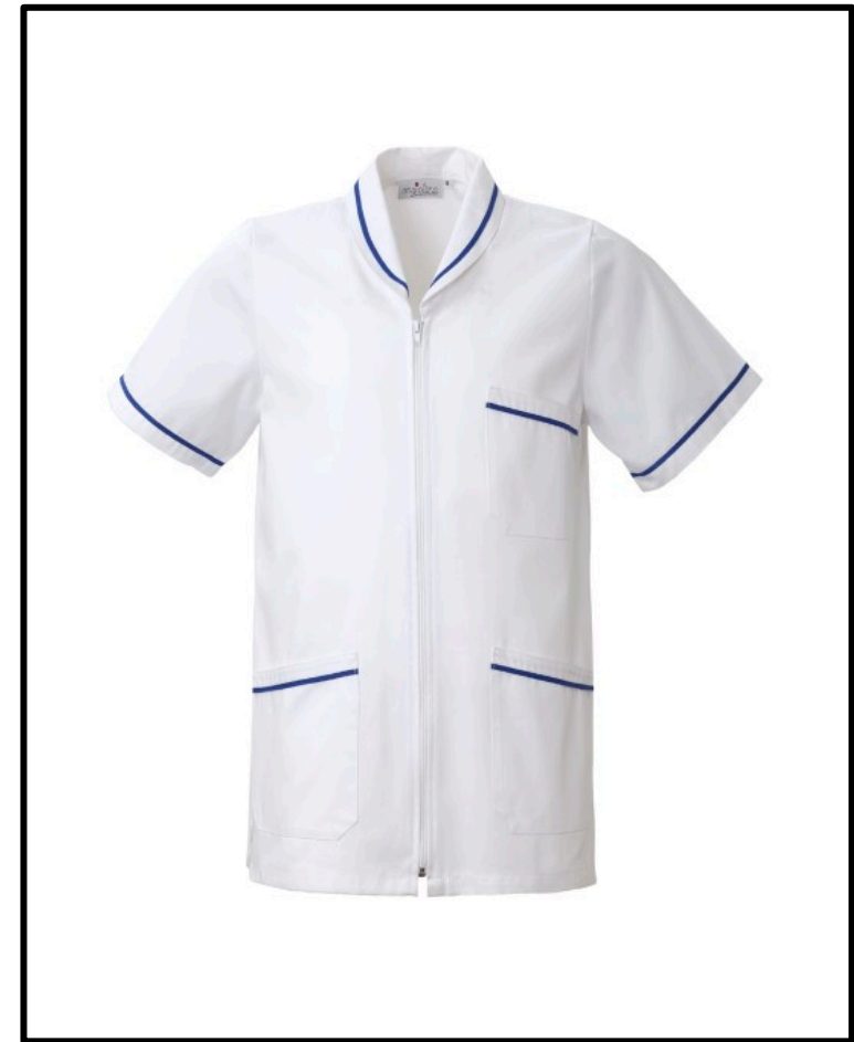
B3 – BIANCO/BLUETTE