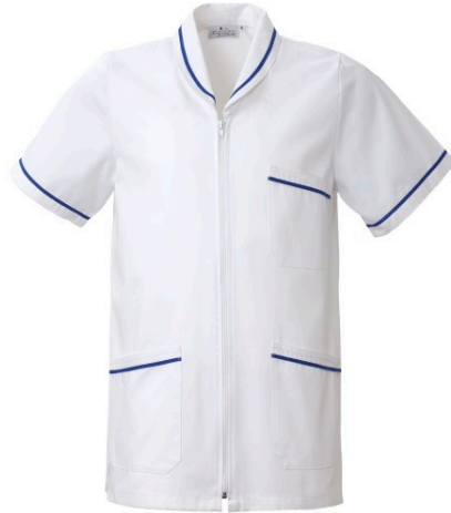
B3 – BIANCO/BLUETTE