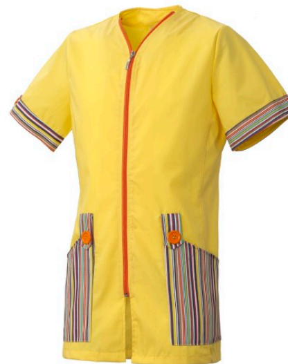
G1 – GIALLO/FANTASIA