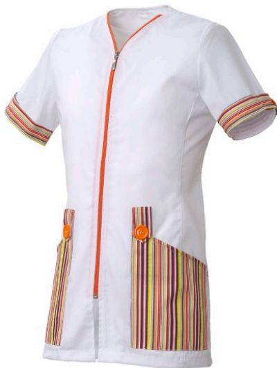
B4 – BIANCO/FANTASIA