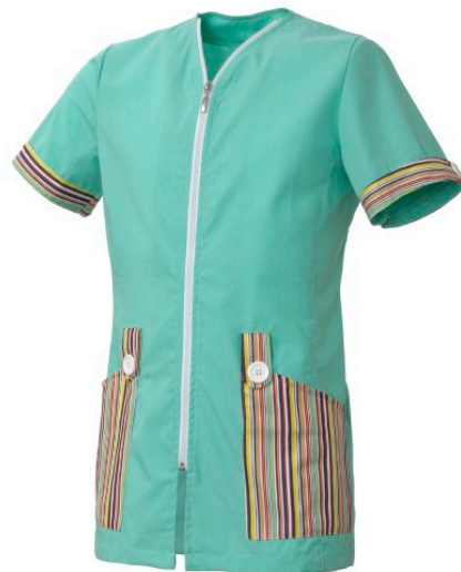
V1 – VERDE ACQUA/FANTASIA