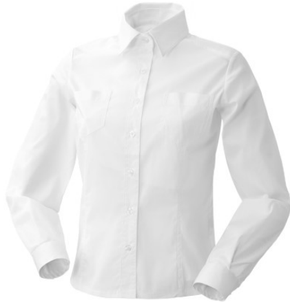
02 – BIANCO