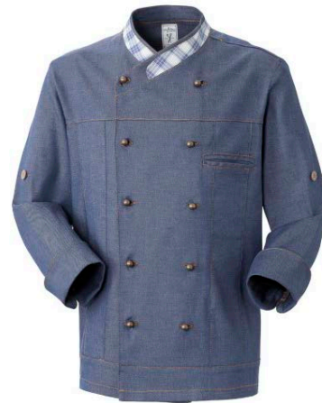
17 – DENIM