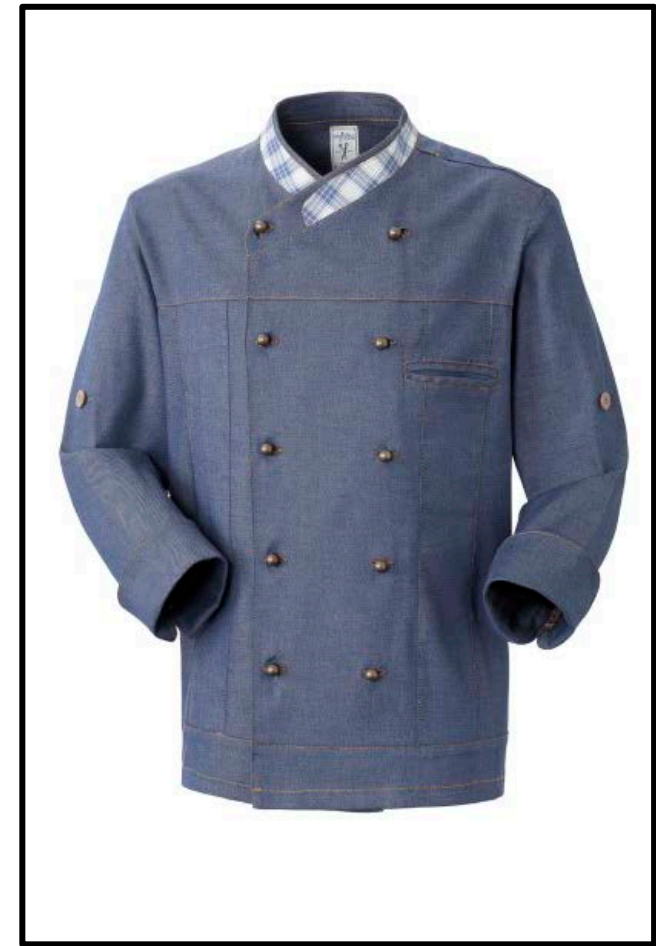
17 – DENIM