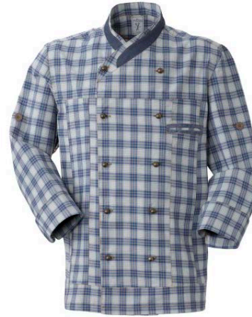
Q1 – CHECK AZZURRO