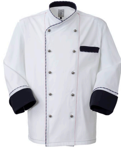
02 – BIANCO