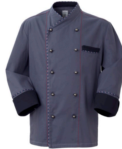
12 – GRIGIO