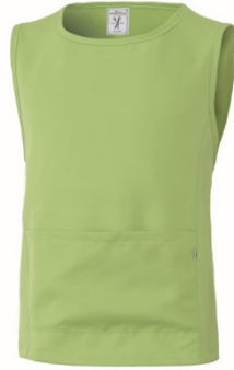
VT – VERDE ACIDO