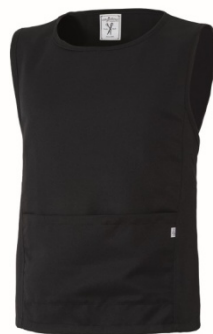
05 – NERO