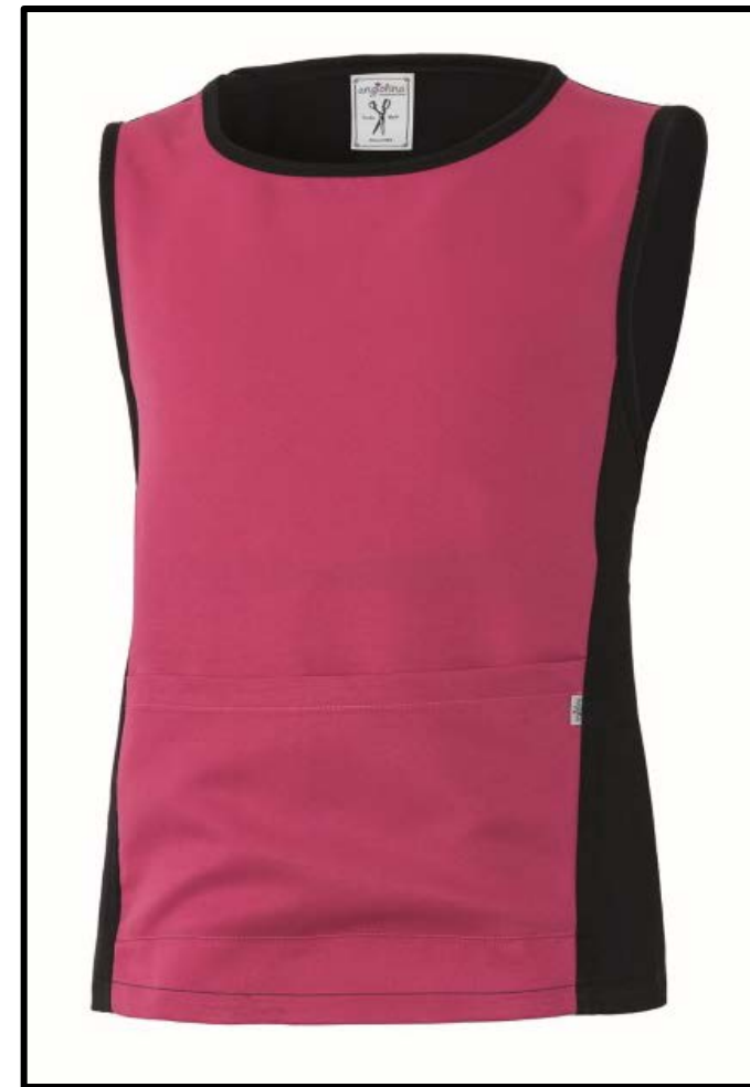
Z1 – NERO/FUXIA