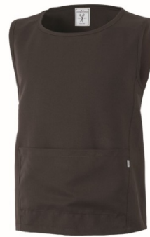
11 – MARRONE