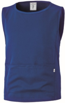
06 – AZZURRO ROYAL