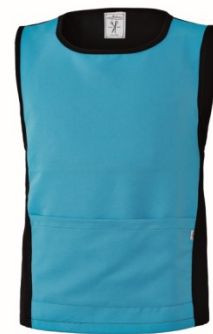
Z2 – NERO/TURCHESE