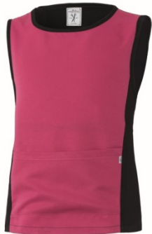
Z1 – NERO/FUXIA