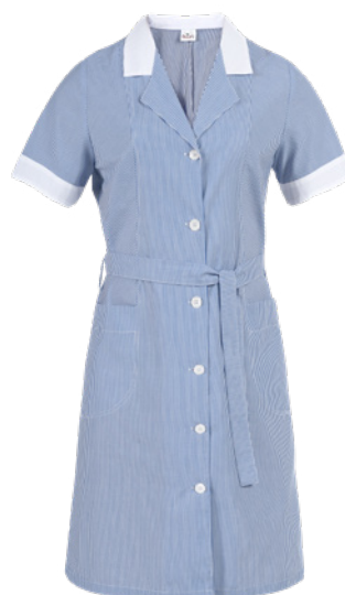
R38 Striped royal