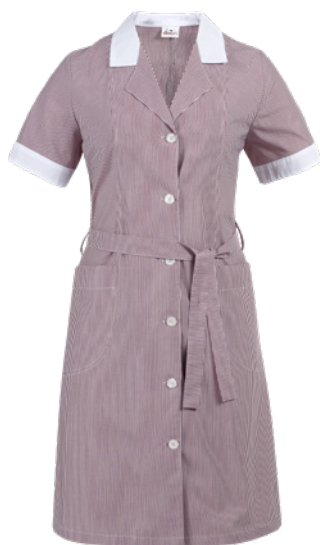
R35 Striped burgundy