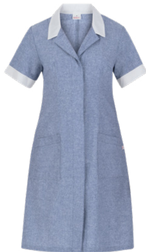
M18 Light blue