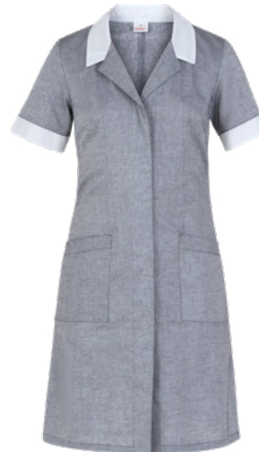
M12 Grigio medio