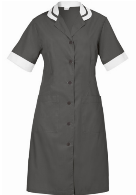
M12 Medium grey