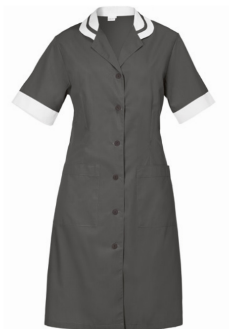
M12 Grigio medio