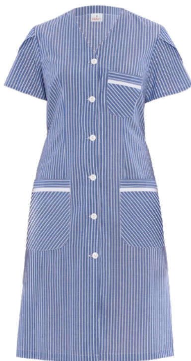
R38 Striped royal