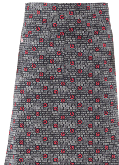
F20 G' horeca