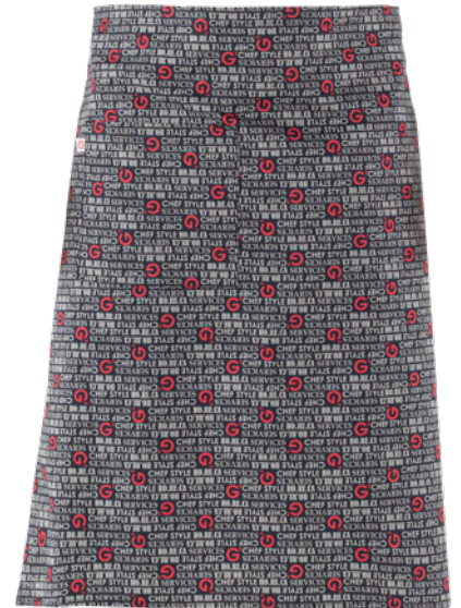
F20 G' horeca