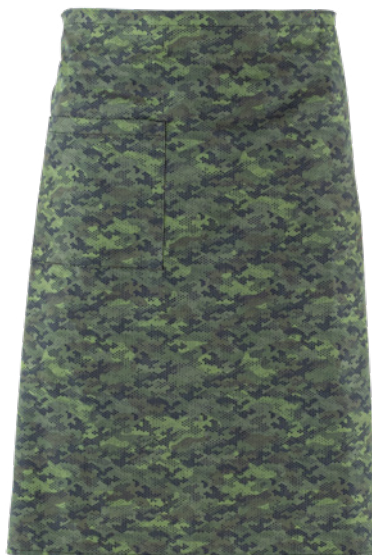
F19 Camouflage pixel