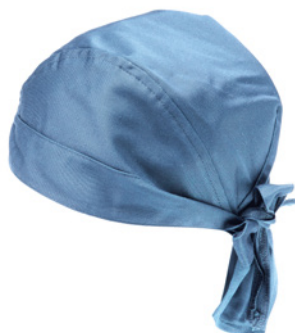
M18 Light blue