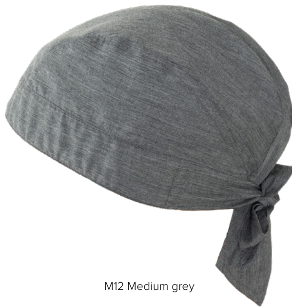
M12 Medium grey