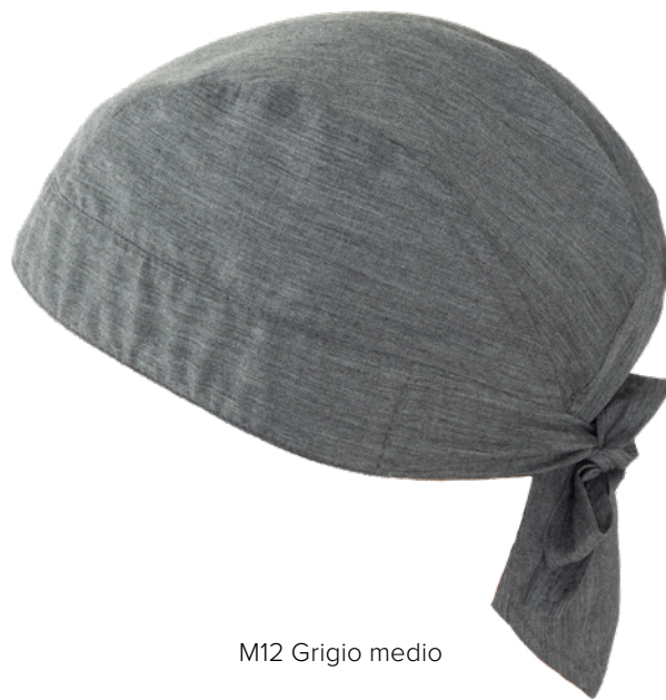
M12 Grigio medio