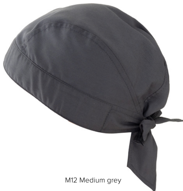
M12 Medium grey