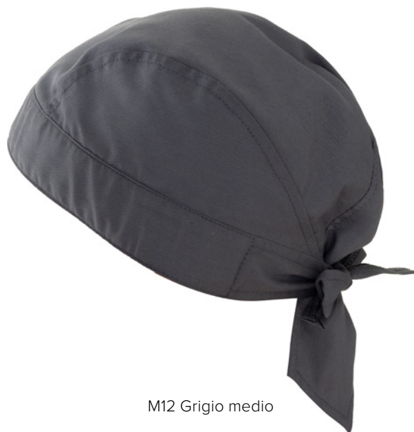
M12 Grigio medio