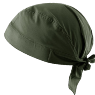
Z43 Verde militare