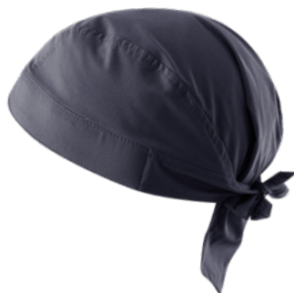
M12 Grigio medio