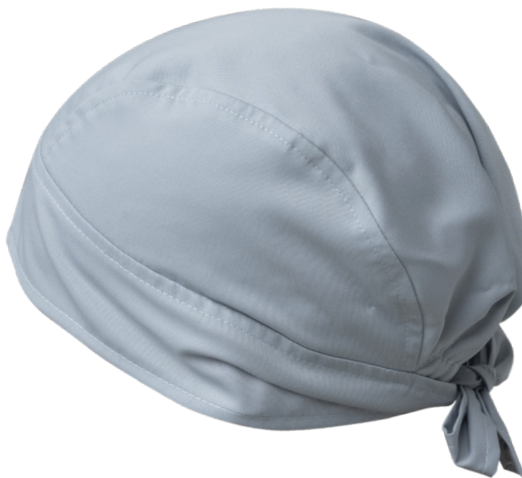
C02 Grigio chiaro