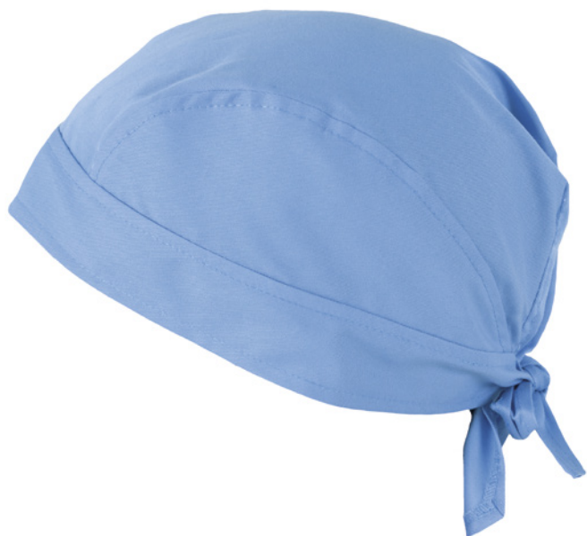
M18 Light blue