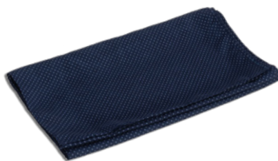
B48 Pois blu