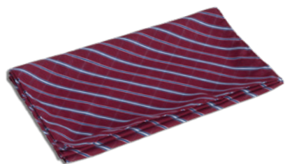
R35 Striped burgundy