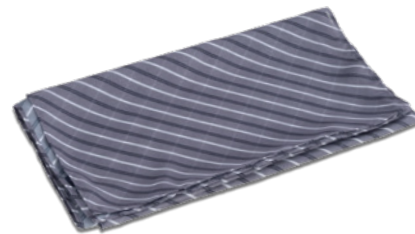
R02 Rigato grigio