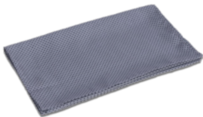
B02 Pois grigio