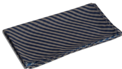
R03 Striped yellow