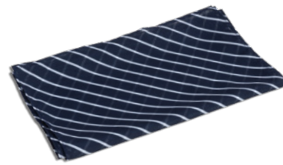
R48 Blu rigato