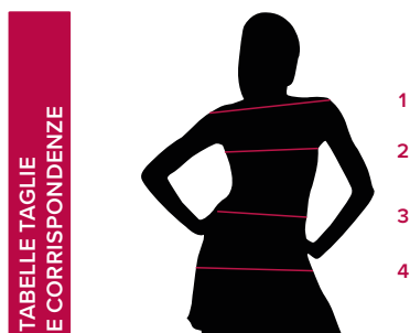
TABELLE TAGLIE E CORRISPONDENZE