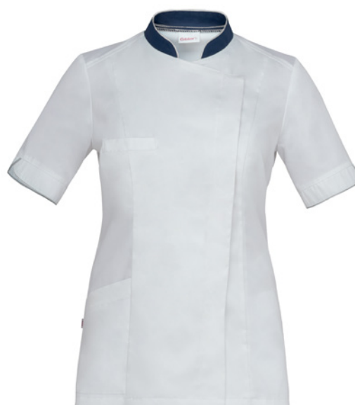
P48 Bianco Blu