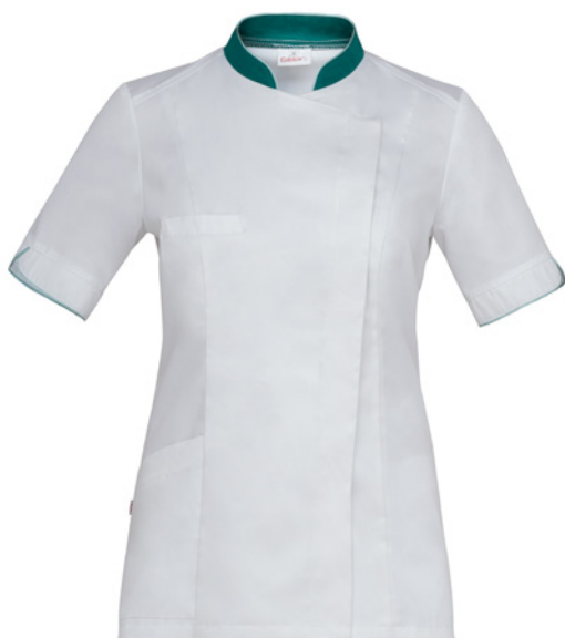
P29 Bianco Verde