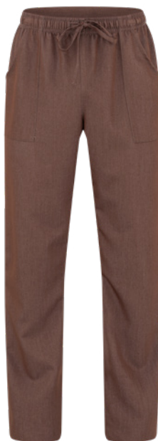
J44 Jeans marrone