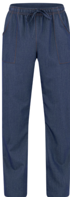
J48 Jeans blu