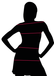
TABELLE TAGLIE E CORRISPONDENZE