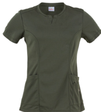
Z43 Verde militare