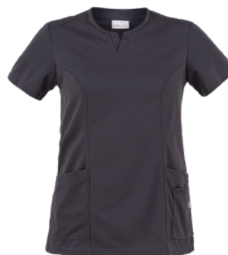
M12 Grigio medio