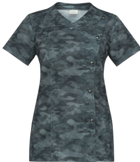
F18 Camouflage blu