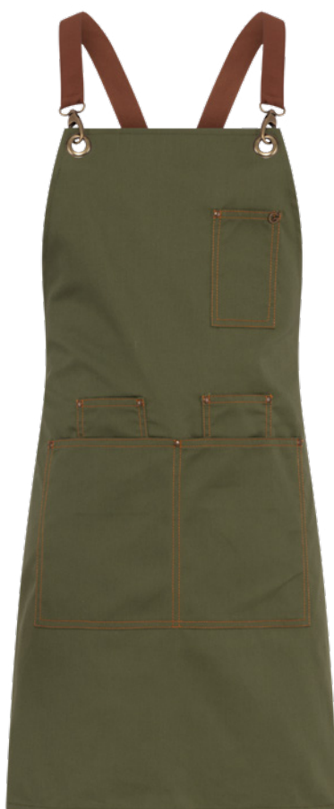
Z43 Verde militare