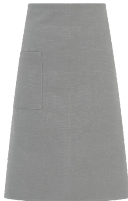
C02 Grigio chiaro