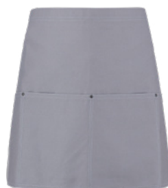
C02 Grigio chiaro