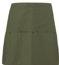
Z43 Verde militare