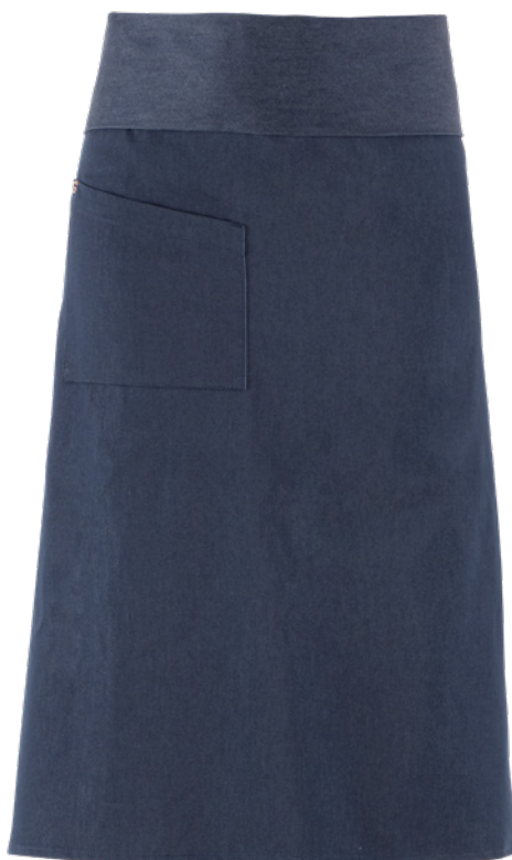
J48 Jeans blu