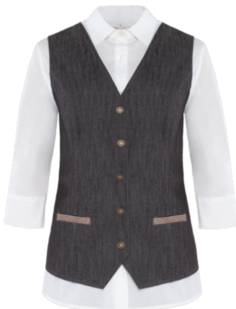
J32 Jeans nero