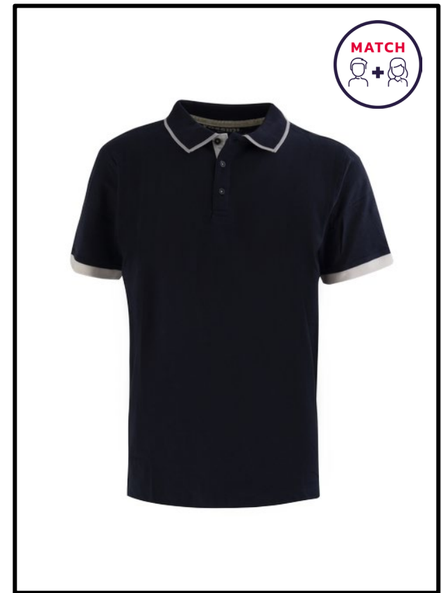
PE – BLEU PETROLE