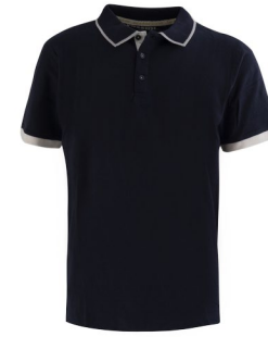
PE – BLEU PETROLE