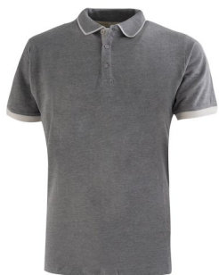
12 – GRIGIO MELANGE