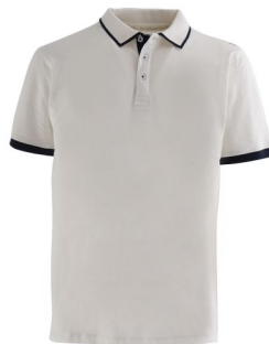
PD – PANNA