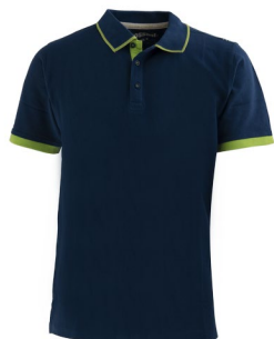
1B – BLEU G