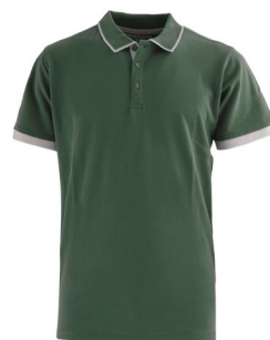
IV – VERDE SALVIA

Polo mezza manica con fascia parasudore interna e bottoniera di colore a contrasto, collo con profilo di colore a contrasto chiuso con tre bottoni, giromanica a costina e spacchetti laterali al fondo di colore a contrasto.