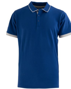
CI- COMO BLUE