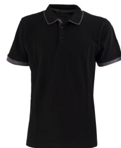
05 – NERO