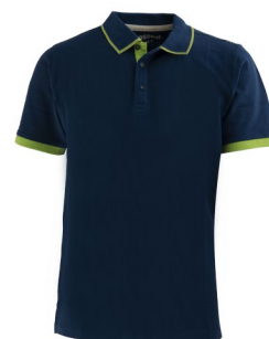
1B – BLUE G