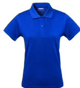
06 – ALBASTRU REGAL