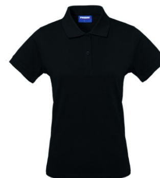
05 – NERO