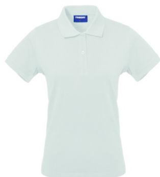
02 – WHITE