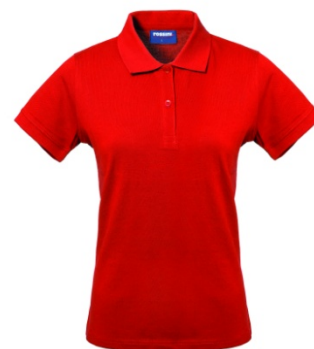
07 – ROJO