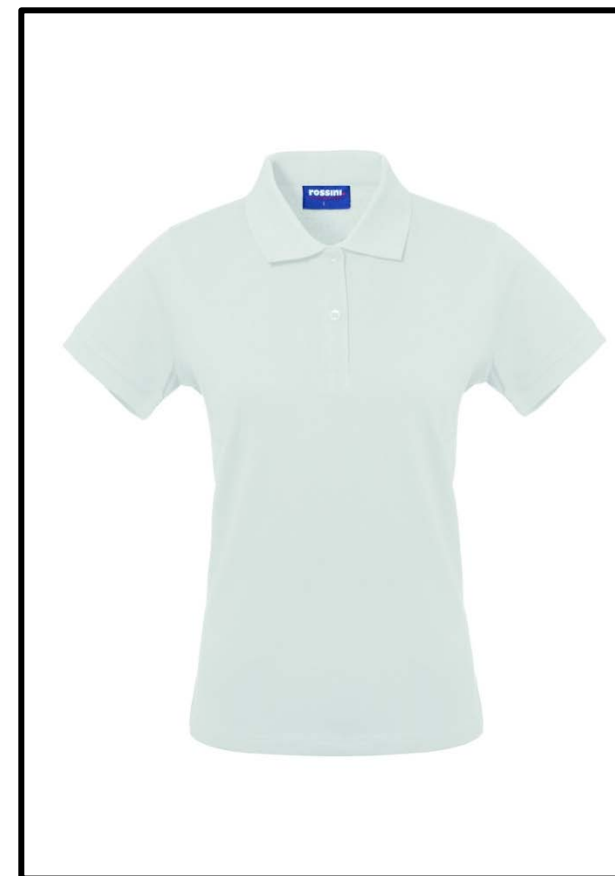
02 – WHITE