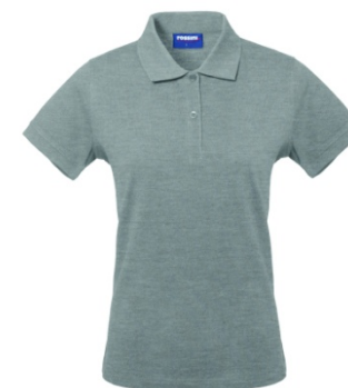
12 – GRIGIO MELANGE