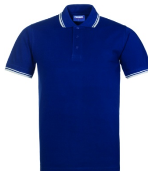
AB – ROYAL BLUE/WHITE