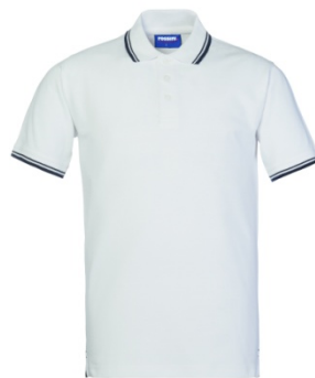
BM – BLANCO/AZUL