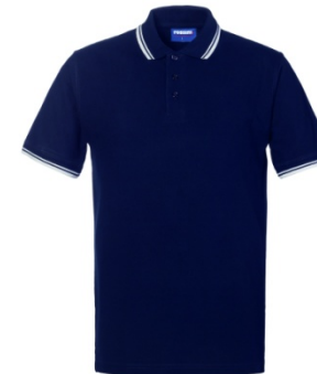
BX – BLEUMARIN/ALB