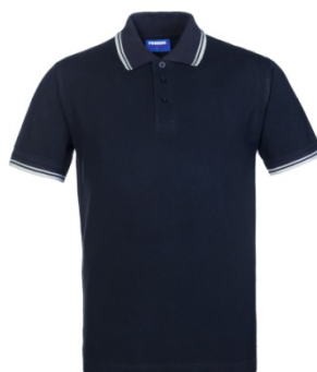
39 – ANTHRACITE/ WHITE