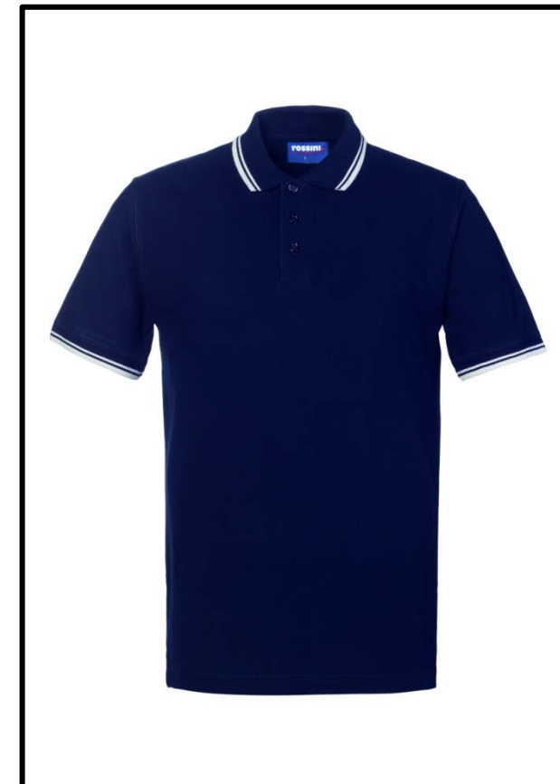
BX – BLUE/WHITE