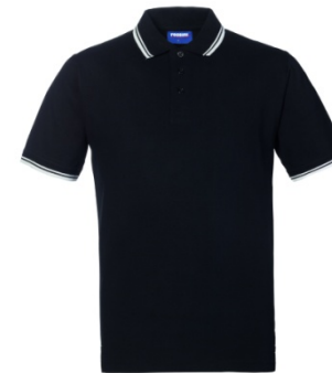
NZ – NEGRU/ALB