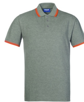
47 – GRIGIO MELANGE/ARANCIO