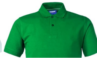
04 – VERDE