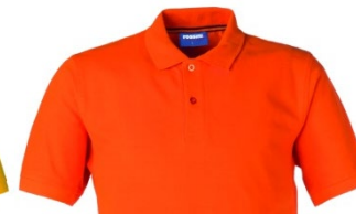
09 – NARANJA