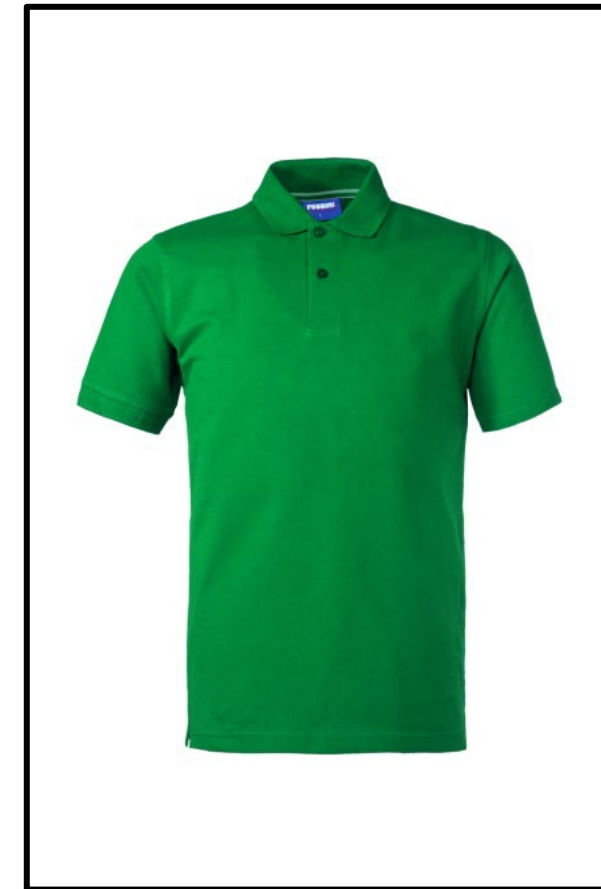
04 – VERDE