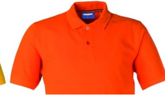
09 – ORANGE