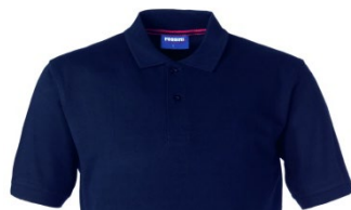
01 – AZUL