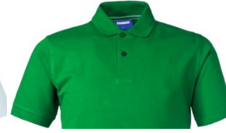
04 – VERT