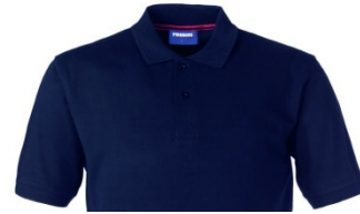
01 – BLUE

Short sleeve polo shirt with contrasting colour sweatband on the back of the collar closed with two buttons, ribbed armhole, side slits at the bottom in contrasting colour.