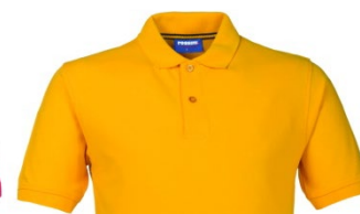
08 – AMARILLO