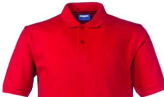
07 – ROJO