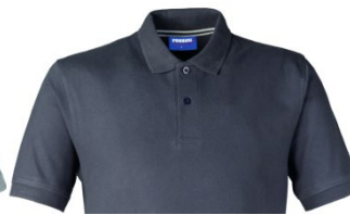
16 – ANTHRACITE