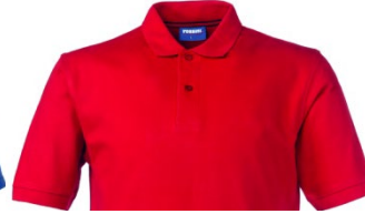
07 – RED