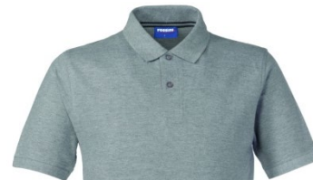
12 – MELANGE GREY