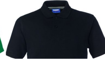
05 – NOIR