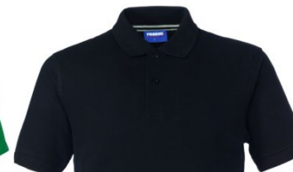
05 – NEGRO