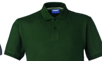
51 – BOTTLE GREEN