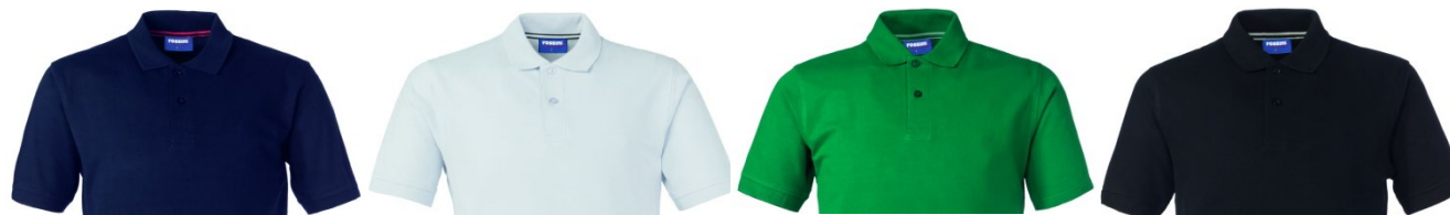
01 – BLEUMARIN