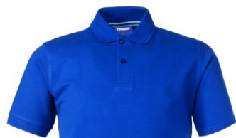
06 – AZUL REAL