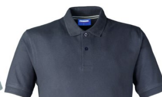
16 – ANTRACITA