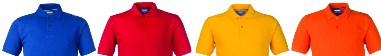
06 – ALBASTRU REGAL