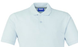
02 – BLANCO