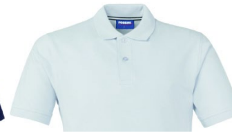
02 – WHITE