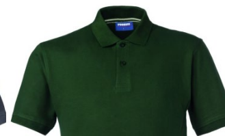
51 – BOTTLE GREEN