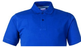
06 – ROYAL BLUE