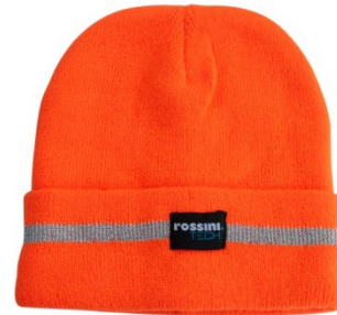
09 – ORANGE