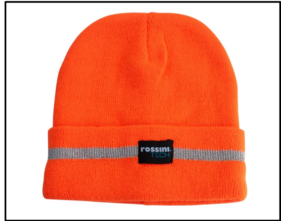
09 – ORANGE