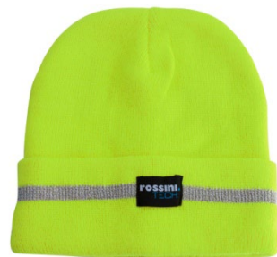
08 – GIALLO

DESCRIZIONE Cappello alta visibilità doppio strato con risvolto.