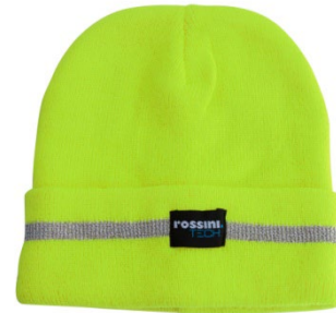
08 – GALBEN

DESCRIERE Căciulă de înaltă vizibilitate strat dublu cu manșetă.