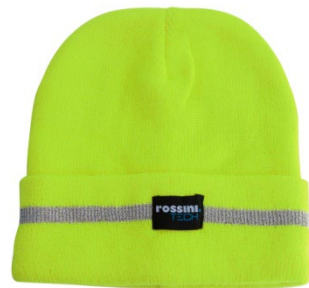
08 – AMARILLO

Gorro de alta visibilidad de doble capa con doblado.