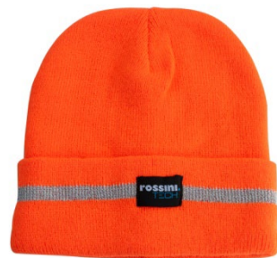
09 – ARANCIO