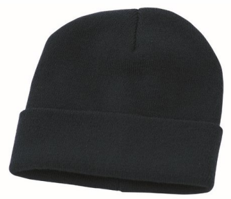
05 – NERO