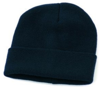
01 – BLU

DESCRIZIONE Cappello doppio strato con risvolto.