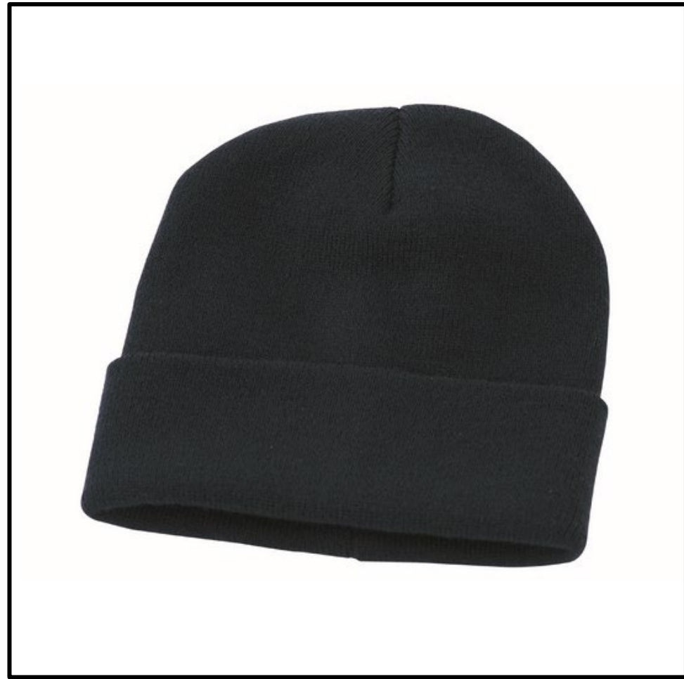
05 – NERO