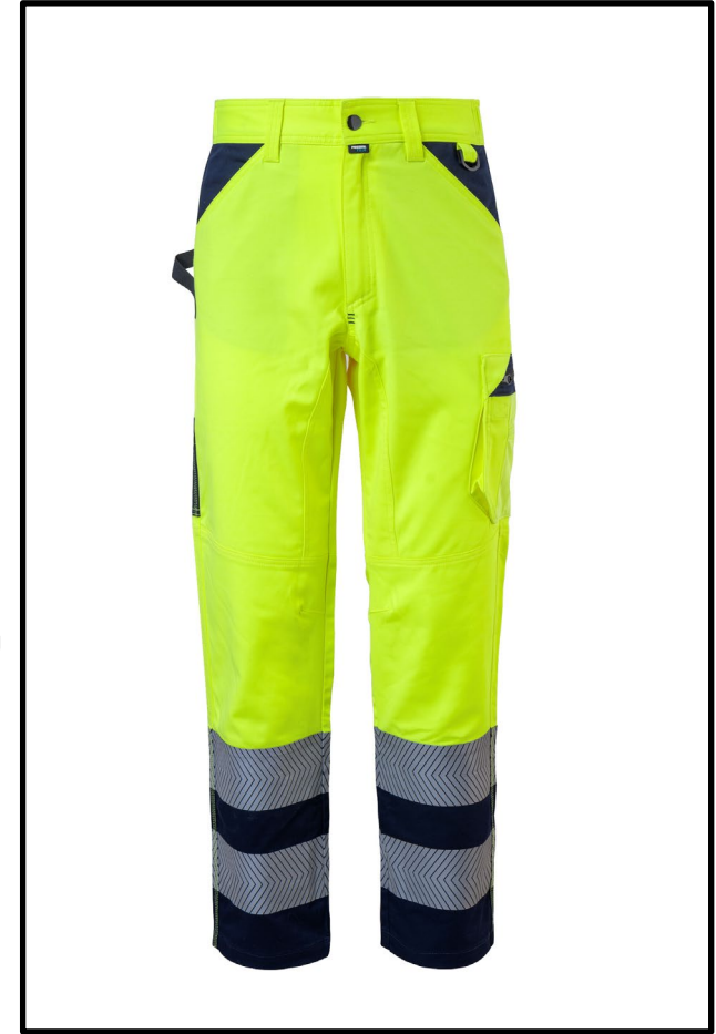
42 – JAUNE/BLEU