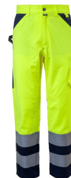
42 – GALBEN/BLEUMARIN