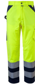
42 – JAUNE/BLEU