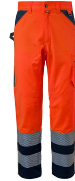
21 – ORANGE/BLEU