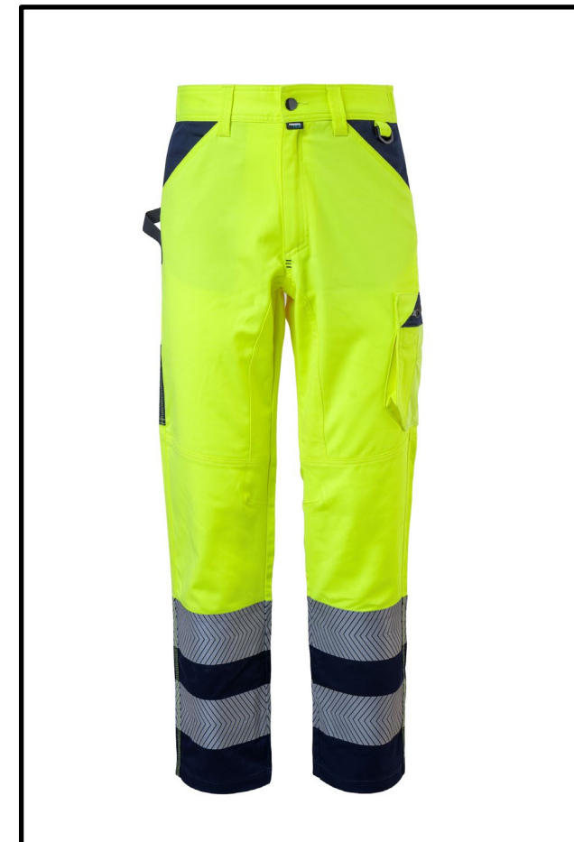
42 - GIALLO/BLU