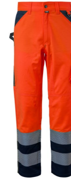
21 – NARAJA/AZUL